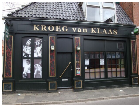
En hier als je er vlak voor staat

Je gaat de Kroeg van Klaas binnen via de deur die ongeveer in het midden zit.