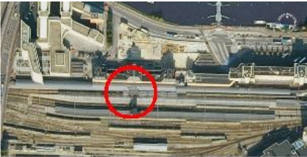
Van bovenaf gezien

Verzamelpunt op het Centraal Station (zie de rode cirkel):