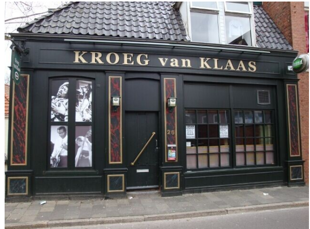
En hier als je er vlak voor staat