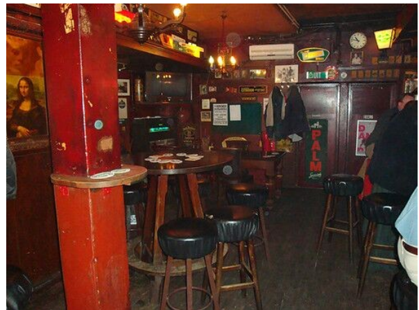
Nu heb je alvast een indruk...

Dit is kroegbaas Fokke de Boer (mocht hij aanwezig zijn dan weet je alvast hoe hij heet en eruit ziet):