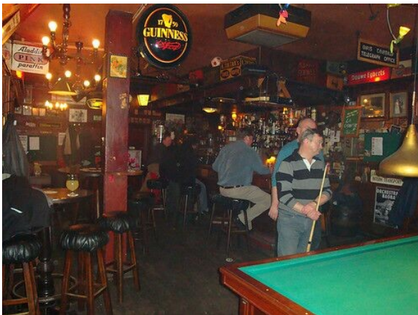
En dit is wat je ziet als je binnen komt

Je gaat de Kroeg van Klaas binnen via de deur die ongeveer in het midden zit.