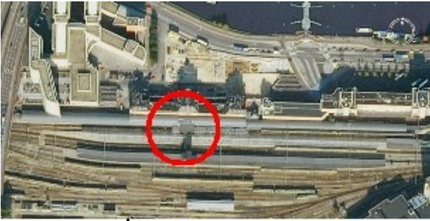
Van bovenaf gezien

Verzamelpunt op het Centraal Station (zie de rode cirkel):