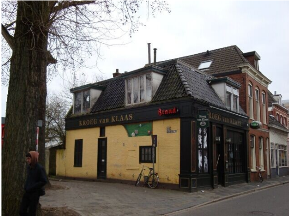
Hier als je er nog naartoe aan het lopen bent

Daarna loop je de Oosterweg in en na ongeveer 500 meter zie je aan de linkerkant de Kroeg van Klaas: