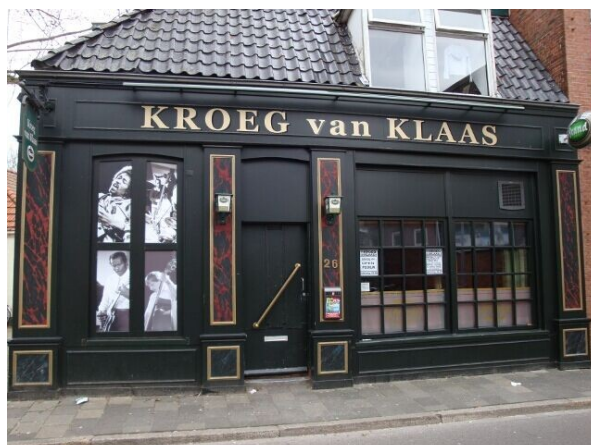
En hier als je er vlak voor staat

Je gaat de Kroeg van Klaas binnen via de deur die ongeveer in het midden zit.