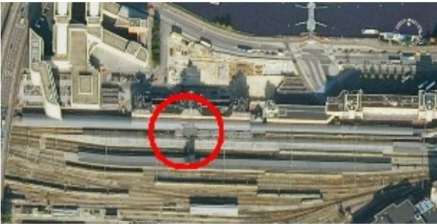
Van bovenaf gezien

Verzamelpunt op het Centraal Station (zie de rode cirkel):