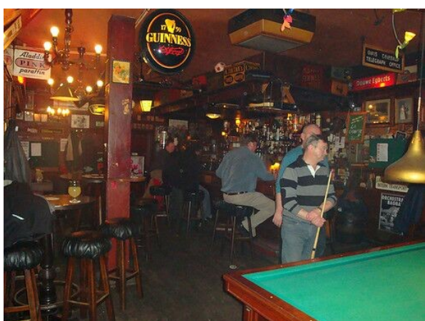
En dit is wat je ziet als je binnen komt

Je gaat de Kroeg van Klaas binnen via de deur die ongeveer in het midden zit.