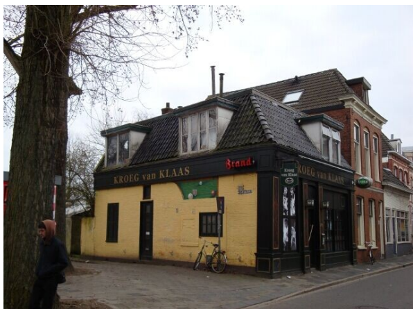
Hier als je er nog naartoe aan het lopen bent

Daarna loop je de Oosterweg in en na ongeveer 500 meter zie je aan de linkerkant de Kroeg van Klaas: