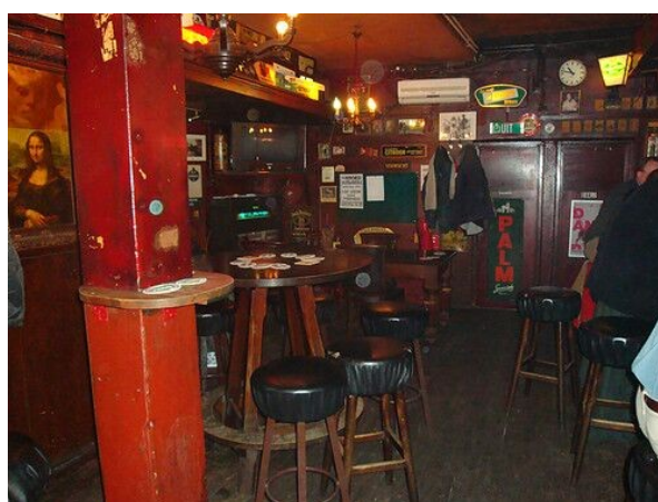
Nu heb je alvast een indruk...

Dit is kroegbaas Fokke de Boer (mocht hij aanwezig zijn dan weet je alvast hoe hij heet en eruit ziet):